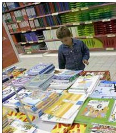
Objetivo: gratuidad de libros de texto

Una vez más, vemos que con el PP una cosa es la teoría y otra la práctica. Una cosa es predicar, y otra dar ejemplo. Y para ellos, la culpa de todo es de Zapatero.