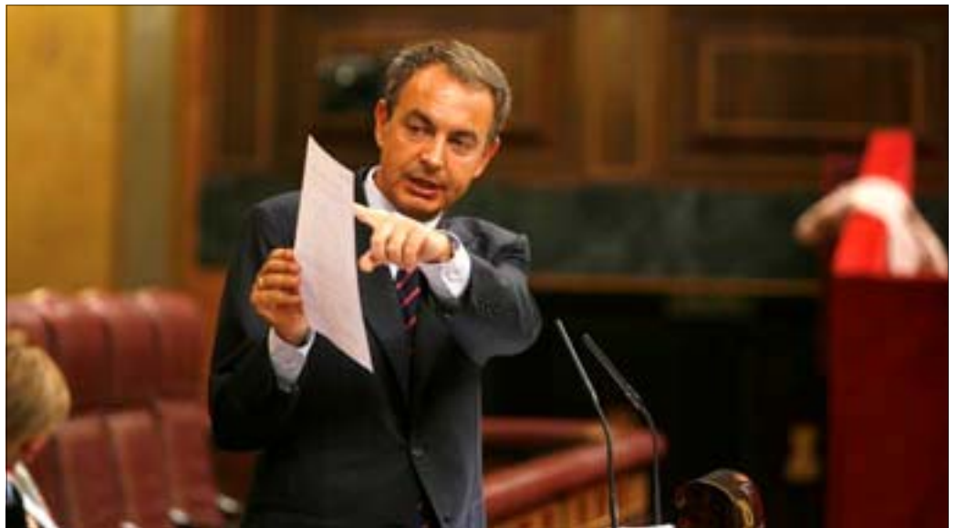
Zapatero, durante su comparecencia en el Congreso para informar de la situación económica

Ante las críticas del líder de la oposición, Zapatero lamentó la "falta de rigor" de Rajoy en su análisis de la situación económica por estar "obsesionado" con un único objetivo, el de culpar al Gobierno de la crisis. Como hizo en julio, el presidente del Gobierno insistió en que el deterioro económico no es exclusivamente español sino que afecta a las principales economías desarrolladas y tiene su causa principal en la crisis financiera internacional, que ha supuesto la restricción del crédito y que reduce la capaci-